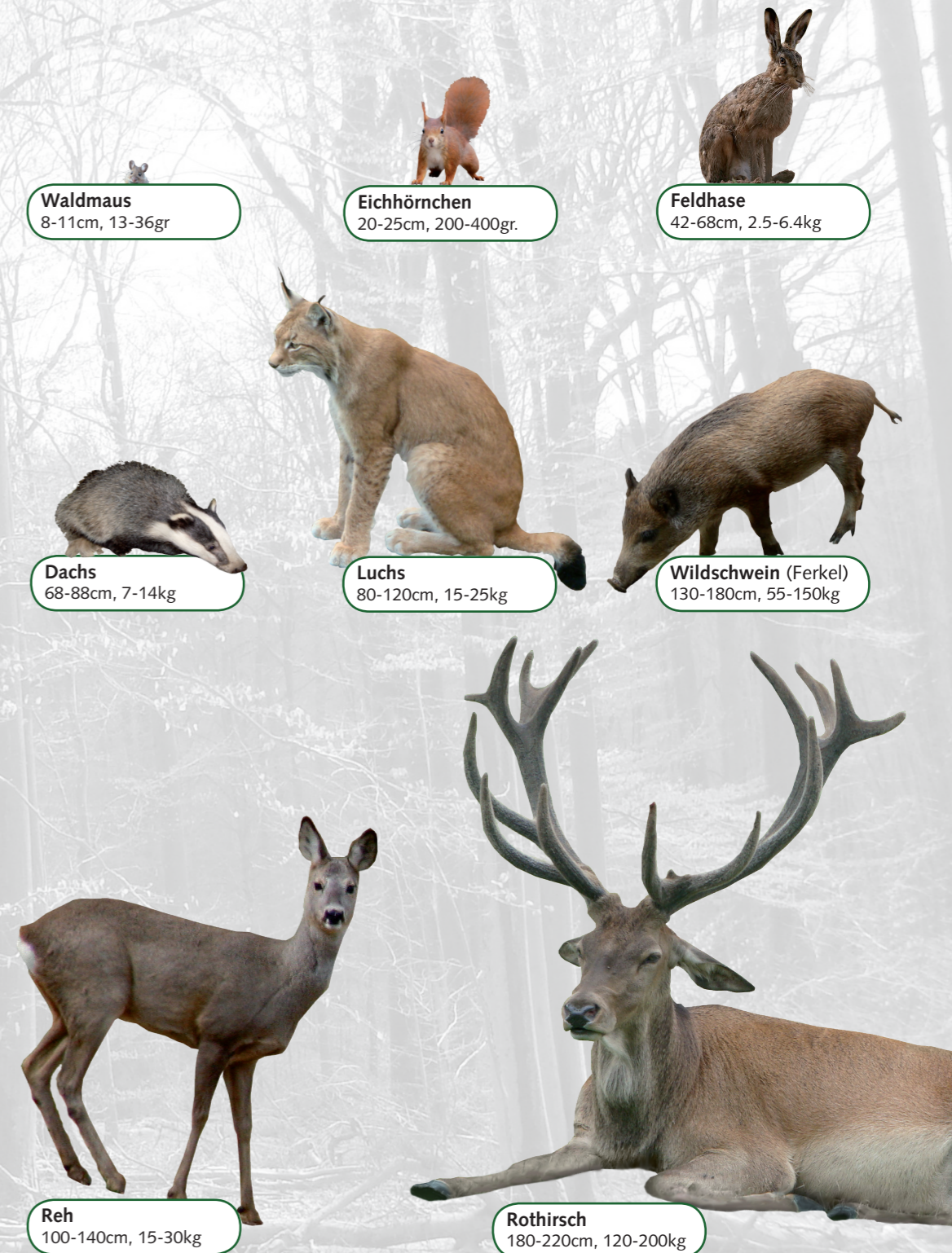
Waldmaus 8-11cm, 13-36gr

Darstellung: Einige der waldbewohnende Säugetiere, proportional zur Körpergrösse. Grössenangabe bezieht sich auf Kopf-Rumpf Länge adulter Tiere.