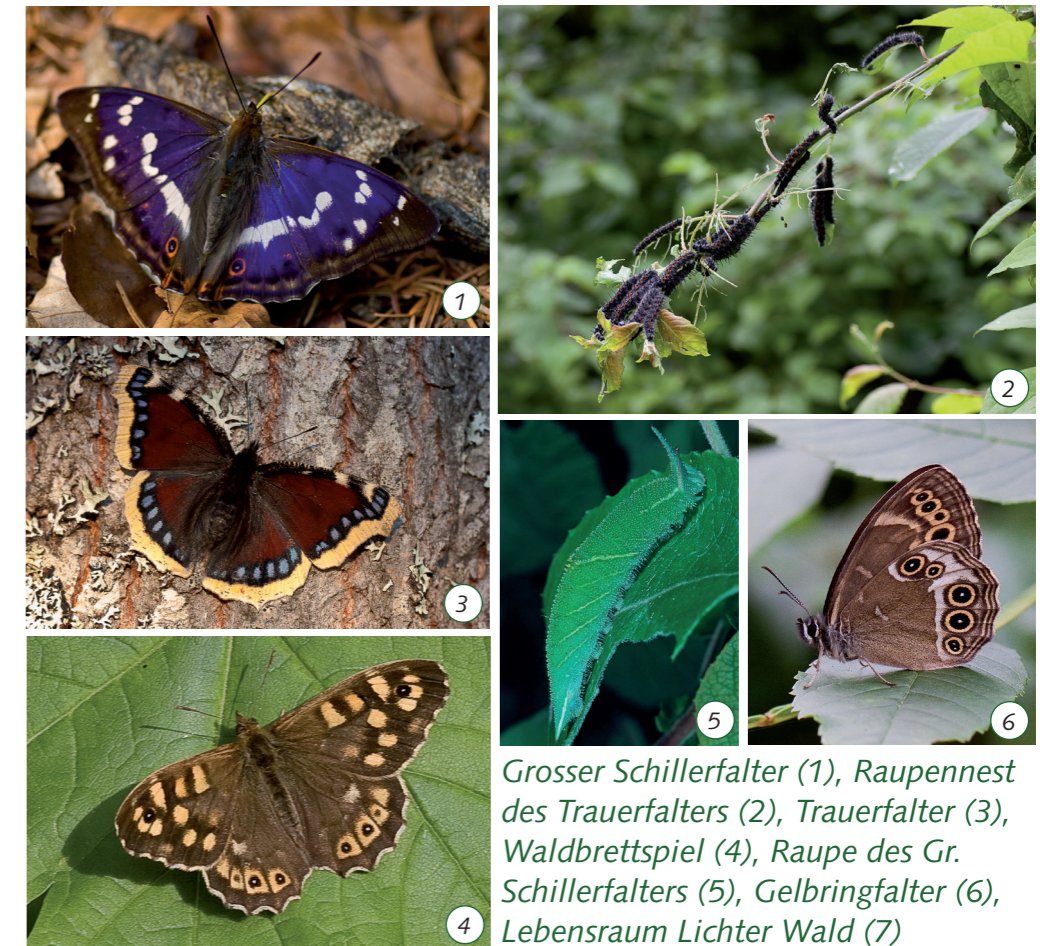
Grosser Schillerfalter (1), Raupennest des Trauerfalters (2), Trauerfalter (3), Waldbrettspiel (4), Raupe des Gr. Schillerfalters (5), Gelbringfalter (6), Lebensraum Lichter Wald (7)

Der „Tagfalterschutz in der Schweiz“ und der Schweizer Vogelschutz SVS/BirdLife Schweiz führen zum Schutz und zur besseren Kenntnis der prachtvollen Waldbewohner eine Suchaktion durch: www.birdlife.ch/Waldtagfalter